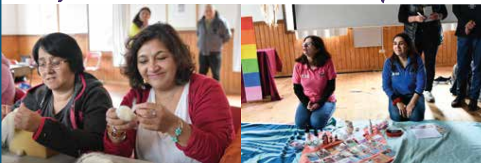
Costura y Lana vellon