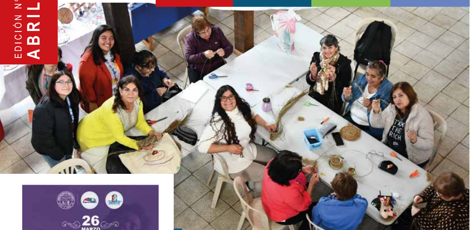
Tejido en manila Aromaterapia